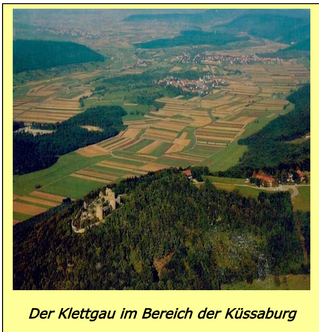
Der Klettgau im Bereich der Küssaburg

Als besonders treuer, kampferprobter Vasall des zum Kaiser gekrönten Friedrich III. wurde Bilgeri von Heudorf 1452 noch in Rom vom dankbaren neuen Kaiser zum Ritter geschlagen und erhielt die „ Rechte und Freiheit “ der Stadt Tiengen am 24. März 1452 von diesem verbrieft. Diese Rechte behielt er, trotz erheblichen Besitzstreitigkeiten um Tiengen mit dem Bischof von Konstanz, bis zu seinem Tod 1456 , inne. Erst der Tod Bilgeris machte schließlich den Konstanzer Bischof zum Sieger der Streitigkeiten - und Tiengen kam somit wieder erneut an das Bistum Konstanz.