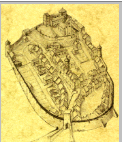
Tiengen um 1400

Die Landgrafen von Stühlingen (siehe dazu Fußnote 2), welche die Stadt nach den Krenkingern erwarben, verkauften diese bereits wieder 1241 an das Bistum Konstanz . Das nun konstanzische Tiengen, das bereits zehn Jahre später, 1251 , durch Graf Heinrich von Lupfen (aus Stühlingen) im Streit mit dem Bischof von Konstanz um das Erbe der ausgestorbenen Grafen von Küssenberg ver- brannt wurde, gab das Bistum Konstanz 1261 wiederum als Lehen an Heinrich von Krenkingen , des- sen Vorfahren (siehe dazu Fußnote 1) bekanntlich die Stadtgründer waren. Dieser nahm den Wie- deraufbau und die erste Erweiterung der Stadt vor.