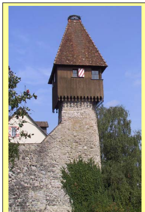
Der sogen. „Storchenturm“ als einziger noch erhaltener Wehrturm mit Stadtmaurerresten.