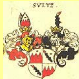
Das neue Wappen „Sulz-Brandis“