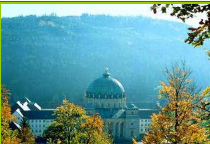
Das Schwarzwaldkloster ST. BLASIEN