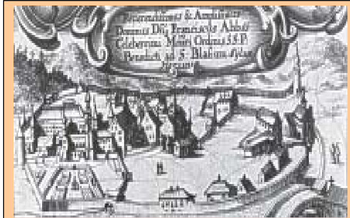
Kloster St. Blasien, Kupferstich 17. Jh.

Die Frühgeschichte der Klöster Rheinau und St. Blasien deutet auf einen Zusammenhang zwischen diesen beiden Klöstern hin, der darauf schließen lässt, dass sich das Kloster St. Blasien aus dem Kloster Rheinau entwickelt hatte. Aus der Geschichte des Klosters St. Blasien in „Wikipedia“, der freien Enzyklopädie, ist darüber folgendes zu erfahren: