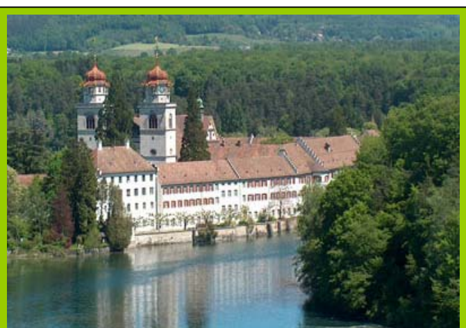
Das Rhein-Kloster RHEINAU