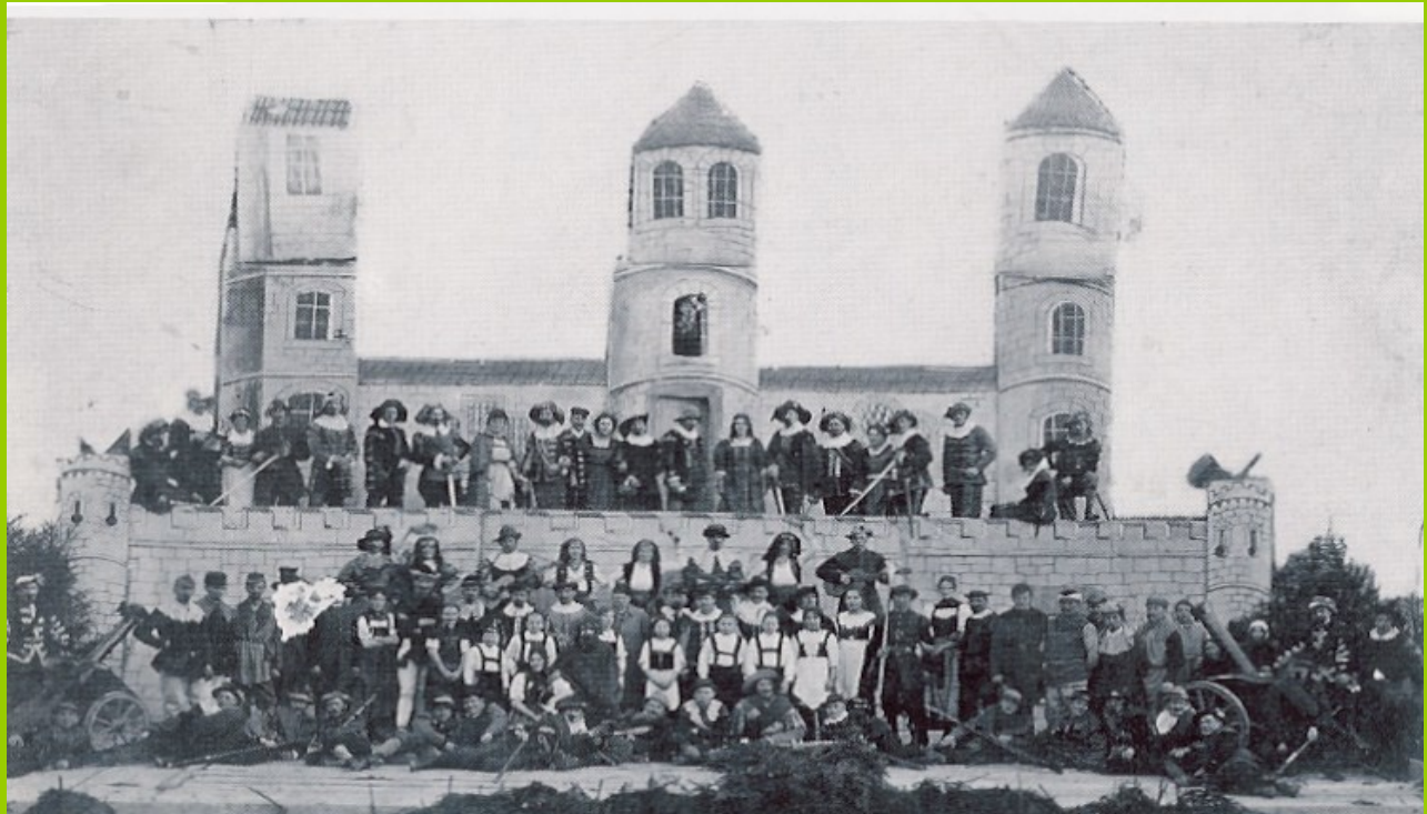
Das Photo zeigt die aufwändigen Kulissenbauten der damaligen Zeit.

Mit der Naturbühne steigerte sich die Theaterqualität noch einmal, und das Schauspiel „ Wilhelm Tell “ von Friedrich von Schiller wurde zum Freilichtspielhöhepunkt. Die Leistungen der Laienspieler wurden von sachkundigen Kritikern anerkannt und gelobt, ja der Südwestfunk schickte 1953 sogar einen Übertragungswagen. Doch leider liefen dem Organisator und Spielleiter die Kosten für Hunderte von Leihkostümen und für die Herrichtung und den Betrieb der Spielstätte davon. Hinzu kam in den Jahren 1952 und 1953 das sommerliche Wetterpech.