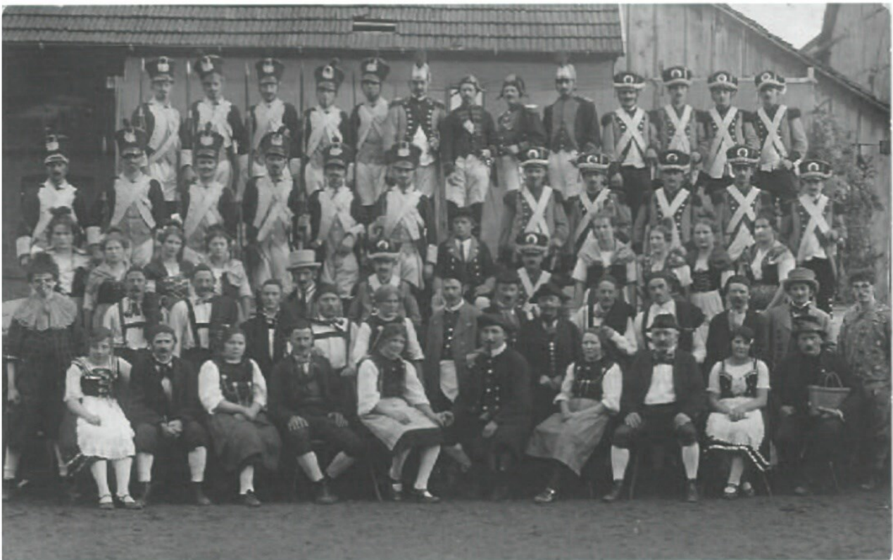
Die Schauspielerschar des Theaterstückes „Andreas Hofer“ im Jahre 1950

Für dieses Freilichtspiel erweiterte er die Laien-Theaterdimensionen beträchtlich. Neben der beachtlich angewachsenen Spielqualität und der stets größer werdenden Zahl der Schauspieler, war vor allem auch der Aufwand für die Kulissenaufbauten in der damaligen Zeit unvorstellbar groß.