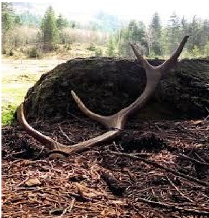
Bild oben: Ein abgeworfenes Hirschgeweih Bilder rechts: Ein Messer-Knauf und ein kunstvoller Kamm aus Hirschhorn