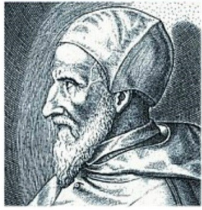
Julius Cäsar und Papst Gregor XIII.

Aber noch einmal kam es zu einer Kalender-Korrektur: Papst Gregor XIII. ließ im Oktober 1582 zehn Tage ausfallen, um sich wieder in den Rhythmus des Sonnenjahrs einzugliedern. Dabei verfeinerte er auch die Schaltjahrregelung: > Jedes durch 100 teilbare Jahr ist kein Schaltjahr, außer es ist durch 400 teilbar.