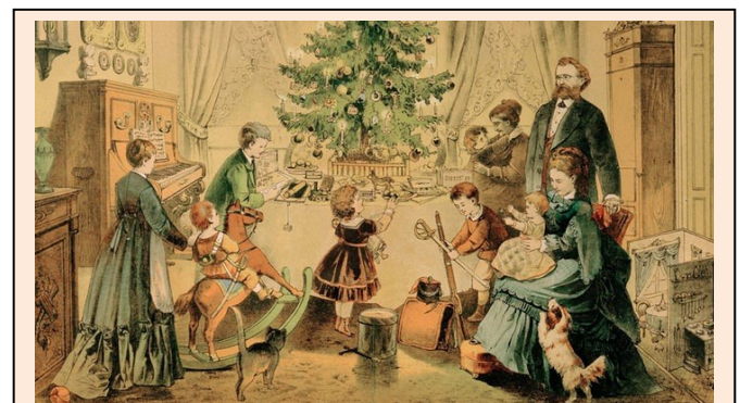
Heilig Abend bei einer bürgerl. Familie Postkarte von 1910