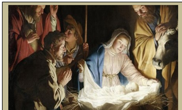
Die Hirten beim neugeborenen Jesus, Gemälde von Gerrit van Honthorst