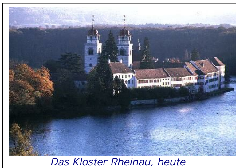
Das Kloster Rheinau, heute