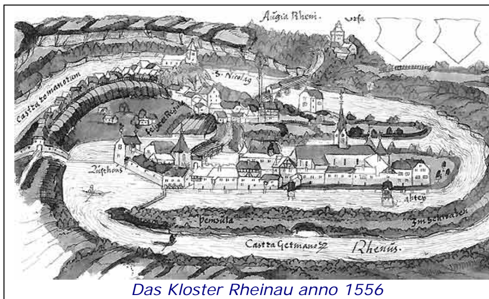
Das Kloster Rheinau anno 1556