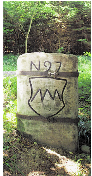
Letzter Grenzstein der ehem. Landgrafschaft im Rafzer Feld aus dem Jahre 1651

„Rafzer Feld“ an die Stadt Zürich. Ein Gebiet, das seit dem Mittelalter zur Landgrafschaft Klettgau gehörte.