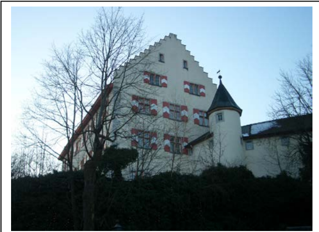
Das Schloss in Tiengen

Die Stadt Tiengen wurde anschließend zum Sitz der Grafen