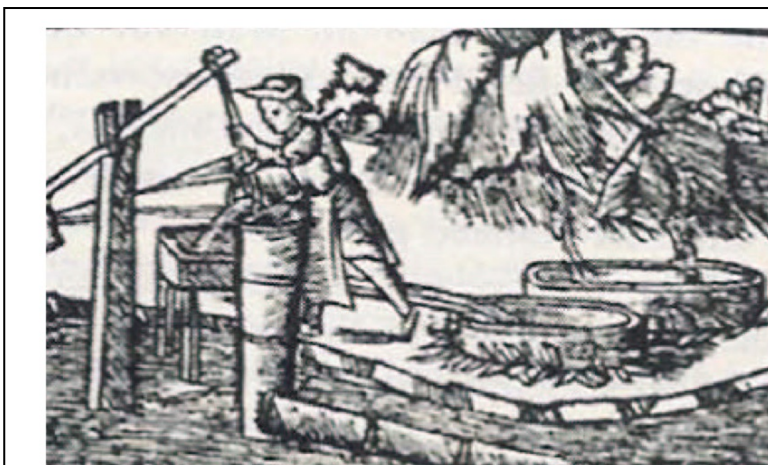
Oben: Sulz a.N. im Jahre 1866 Unten: Zeitgenössische Darstellung, Salzsieder 1555

Die ersten Besitzer der Saline waren im 11. Jahrhundert die Grafen von Sulz , die bereits im Jahr 910 urkundlich genannt werden. Seit Mitte des 12. Jahrhunderts hatte der jeweils Älteste des Geschlechts das Amt des Erbhofrichters zu Rottweil inne, außerdem gehörten die Adelsfamilie