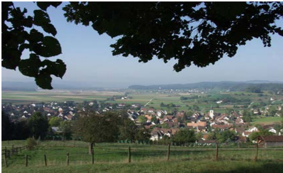
Der Ort Rafz – und das nach ihm benannte Rafzerfeld