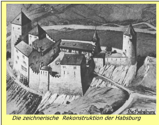
Die zeichnerische Rekonstruktion der Habsburg