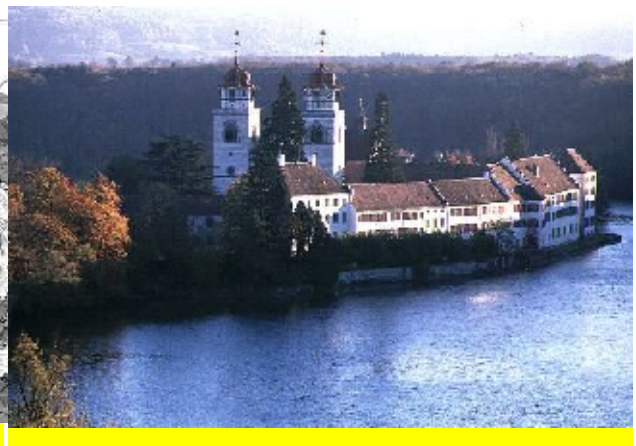
Das Kloster Rheinau heute

Und wenn es diese Heilige Notburga wirklich gegeben haben sollte, dann ist sie wohl auf Weisung des Klosters Rheinau in Bühl auf dem markanten felsigen Wohnplatz über dem Schwarzbach (wo heute die barocke Kirche + gotischem Pfarrhaus steht) angesiedelt worden, wo sie sich u.U. der Armenfürsorge gewidmet hat. Die historischen Quellen im Bezug auf das Kloster erwähnen, dass gerade in der damaligen Zeit eine große Hungersnot herrschte, so dass es denkbar ist, dass Notburga sich u.a. vor allem der vielen in elenden Verhältnissen lebenden Waisen Kinder annahm. Die Darstellung der Heiligen, mit den Neunlingen im Arm und einem tote Kind am Boden, könnten daher durchaus auch als Bild der Fürsorge für arme und hungernde Kinder gedeutet werden, bei dem die Frömmelheit der späteren Jahrhunderte die Legende dann aber so formte, wie man sie eben haben wollte.