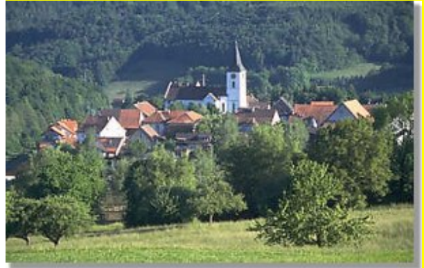
Der Ort Bühl mit seiner Kirche

Notburga starb im Jahre 840 und wurde in der von ihr erbauten Kapelle bestattet. Sie floh schwanger, weil Ihr Ehemann nach der Thronbesteigung ermordet wurde und gebar im Klettgau, in der Ortschaft Bühl, Neunlinge. Die Sage erzählt, dass ihr seinerzeit das Wasser zum Taufen ihrer Kinder fehlte, weshalb sie mit einem Stab einen Felsen berührte, aus dem eine Quelle sprudelte. An dieser Stelle wurde dann eine Kirche gebaut, wo sich heute die Pfarrkirche von Bühl befindet, die sich über einem Felsen erhebt, unter dem der Schwarzbach fließt.